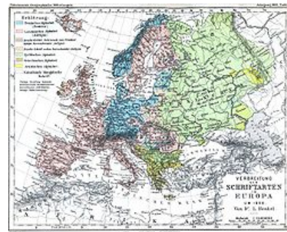
Alfabetos de Europa en 1901.